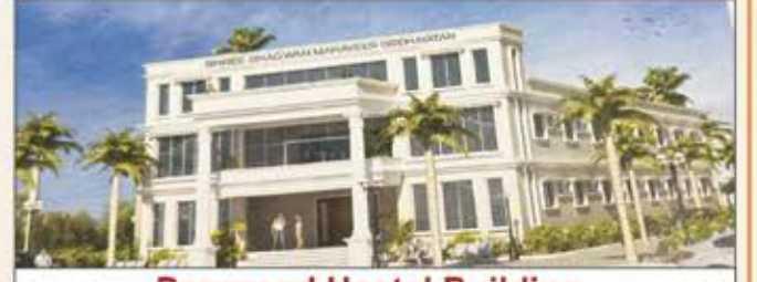
Proposed Hostel Building