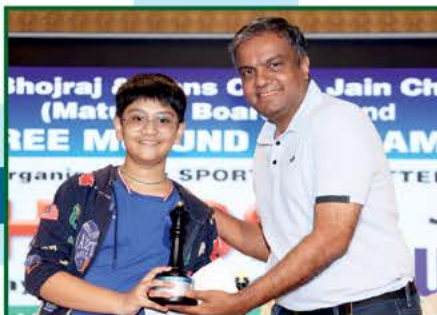
દ્વિતીય : સિવાન છેડા (ગોધરા)