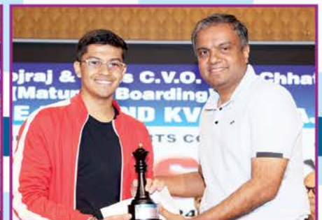
દ્વિતીય : વંશ રસીક ગાલા (નૂતન ત્રંબો)