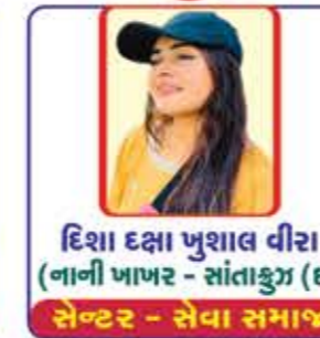
દિશા દક્ષા પુજશાલ વીરા (નાની ખાખર - સાંતાક્રુઝ (ઈ)) સેન્ટર - સેવા સમાજ