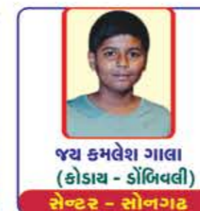
જય કમલેશ ગાલા (કોડાય - ડોંબિવલી) સેન્ટર - સોનગઢ