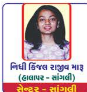
નિધી કિંજલ રાજુભ માડુ (હાલાપુર - સાંગલી) સેન્ટર - સાંગલી