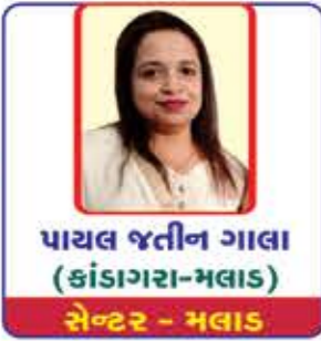
પાચલ જતીન ગાલા (કાંડાગરા-મલાડ) સેન્ટર - મલાડ