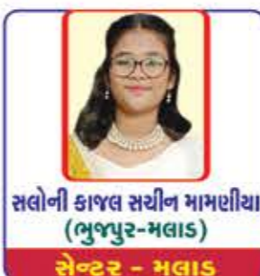
સલોની કાજલ સચીન મામણીયા (ભુજપુર-મલાડ) સેન્ટર - મલાડ