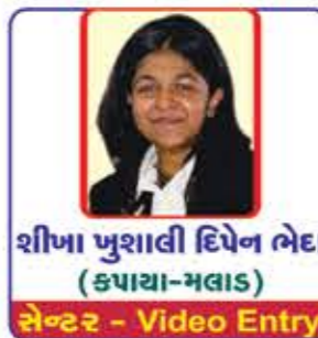
શીખા પુજશાલી દિપેન ભેદા (કપાયા-મલાડ) સેન્ટર - Video Entry