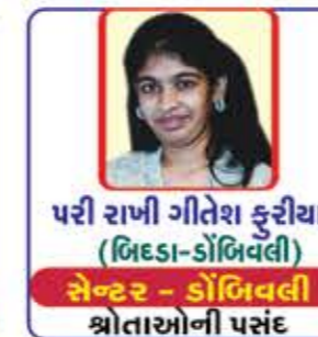
પરી રાખી ગીતેશ કુરીયા (બિંદાસ-ડોંબિવલી) સેન્ટર - ડોંબિવલી શ્રોતાઓની પસંદ