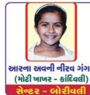
આરુના અવની નીરવ ગંગર (મોટી ખાખર - કાંઠિવલી) સેન્ટર - બોરીવલી