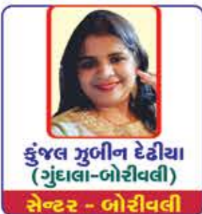
કુંજલ મુબીન દેઢિયા (ગુંદાલા-બોરીવલી) સેન્ટર - બોરીવલી