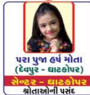
પરા પુજા હર્ષ મોતા (દેવપુર - ઘાટકોપર) સેન્ટર - ઘાટકોપર શ્રોતાઓની પસંદ