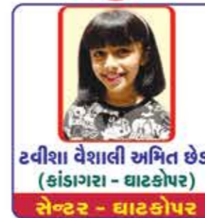
ટવીશા વેશાલી અંબિત છેડા (કાંડાગરા - ઘાટકોપર) સેન્ટર - ઘાટકોપર