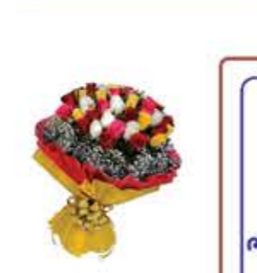
ભરત ધર્મચંતી ધામજી હરીયા (ગોધરા - થાણા) સેન્ટર - થાણા