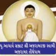
પૂ. આચાર્ય સગરજી શ્રી અજરામરજી સ્વામી અજરામર તીર્થધામ