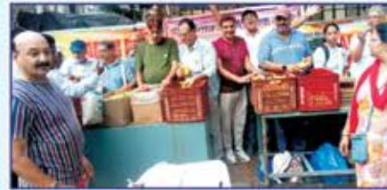
અનુકંપાનું સ્થળ: KEM Hospital ની પાછળ, ડોક્ટર ક્વાટરની સામે, પરેલ.