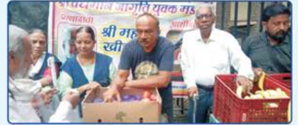
કાળઝાળ ગરમી, કાતિલ ઠંડી અને ધોધમાર વરસાદમાં પણ સવારના ૭ વાગ્યે નિઃસ્વાર્થ સેવા માટે તત્પર કાર્યકરો

TATA Hospital માં Cancer ના જરૂરમંદ દર્દીઓને સારવાર માટે એમના ટ્રસ્ટ એકાઉન્ટમાં ખર્ચ મુજબ ચેક સંસ્થા તરફથી આપવામાં આવે છે.