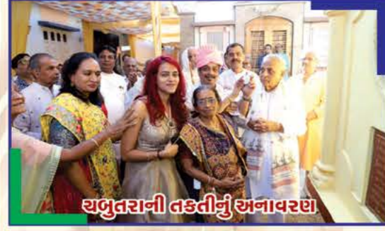
ચતુતરાની તકતીનું અનાવરણ