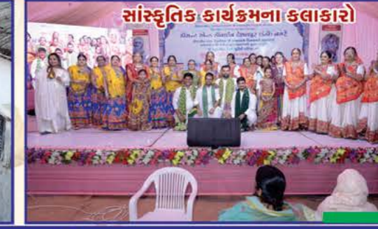
સાંસ્કૃતિક કાર્યક્રમના કલાકારો