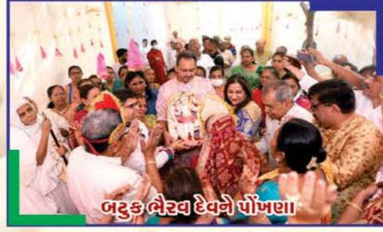
બટુક ભૈરવ દેવને પોંખણ