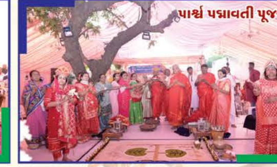
પાર્શ્વ પદ્માવતી પૂજન