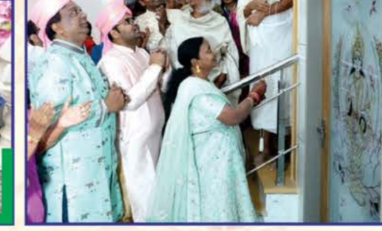
દેરાસરની પેઢીની તકતીનું અનાવરણ કરતાં લાભાર્થી પરિવાર