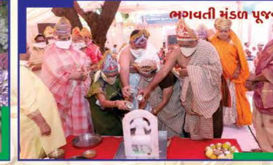
ભગવતી મંડપ પૂજન