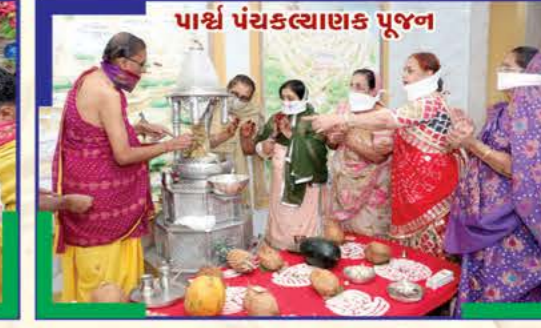
પાર્શ્વ પંચકલ્યાણક પૂજન