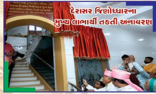
દેરાસર જિણોધારના મુખ્ય લાભાર્થી તકતી અનાવરણ