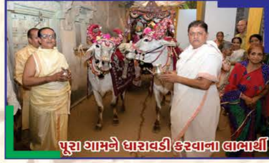
પૂરા ગામને દારાવડી કરવાના લાભાર્થી