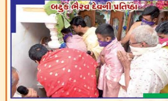
બટુક ભૈરવ દેવની પ્રતિષ્ઠા