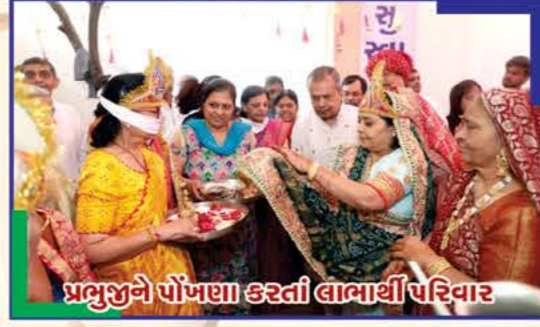
પ્રભુજીને પોંખણ કરતી લાભાર્થી પરિવાર