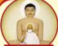
શ્રી અજરામર તીર્થધામ