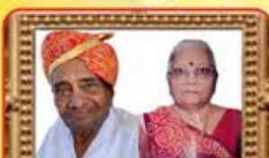
HEROTEX HURRICANES જવેરબેન મુલજી ગાલા - મહેશ ટેક્સટાઈલ્સ