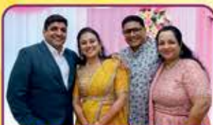
GLORIOUS GALAS દિપેન અને મચુર ગાલા