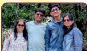
SAVLA STRIKERS જવેરબેન વસનજી સાવલા