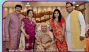
KWALITY KINGS જાગૃતિ બિપીન મગનલાલ ગડા