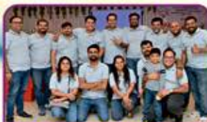
MOTA ASAMBIYA YOUTH CLUB મોટા આસંબીયા યુથ ક્લબ