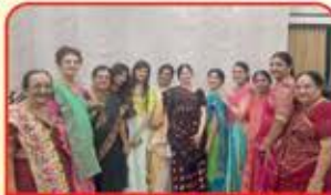
ASAMBIYA UNITED મોટા આસંબીયા પ્રગતિ મહિલા મંડળ