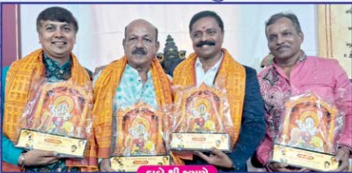
ડાબે થી જમણે