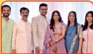
JALSHA કંચન જવેશ લખમશી સાવલા