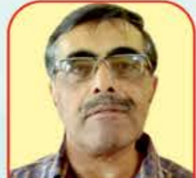
શ્રી નિરુપમ છાયા શ્રી સદાગમ પ્રવૃત્તિ સંસ્થાની દસ્તાવેજી હકીકતો પરથી સમગ્ર શબ્દચિત્ર ઉપસાવનાર