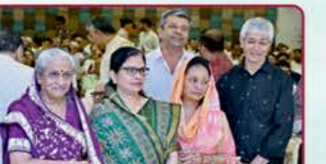
સમાજના જ્ઞાનપિપાસુઓની ઉપસ્થિતિ