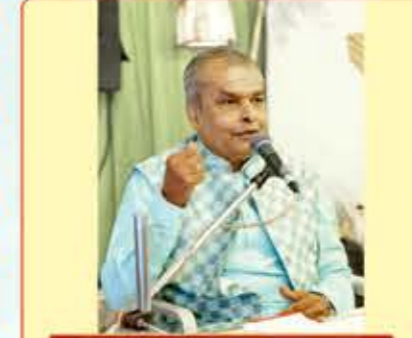
: સૂત્રાધાર :

કોઈ વ્યક્તિને નવજીવન આપીએ તો ૫૦-૧૦૦ વર્ષ જીવે પણ ગ્રંથોને જીવાડીશું તો કેટલા આત્માઓમાં સમ્યક્ જ્ઞાનની વૃદ્ધિ થશે એ સમજાવી ૫૦૦ વર્ષ ટકી શકે એવા પોંડીચરીનાં કાગળ અને પ્રાચીન સમયમાં વપરાતી કુદરતી શાહીમાં એનું લેખન કાર્ય થશે એ સાથે શ્રમણ સત્સંગની વાણી અને એની સલાહને આધીન આ સંસ્થા રહેશે એનો પણ સંતોષ વ્યક્ત કર્યો હતો. સંપૂર્ણ સંકુલ અને વિવિધ સંલગ્ન આયોજનો માટે ૧૫ કરોડ જેટલી રકમની આવશ્યકતા હોવાનું જણાવી આ પુણ્ય કાર્યનો લાભ લેવા અને સંસ્થાની ઝોળી છલકાવી દેવા જણાવતાં તેમણે જૈન સંઘ અને સમાજને વાંચતા કરવાના છે, ગુજરાતી, સંસ્કૃત અને પ્રાકૃત ભાષાઓને નવજીવન આપવું છે એ માટે આ સદાગમ સંસ્થાની પીઠ મજબૂત કરવા આગળ આવવા સહુને તેજસ્વી વાણીમાં પ્રેરિત કર્યા હતા. અંતે, અંતરની મંગલમય શુભ ભાવના વ્યક્ત કરી હતી.