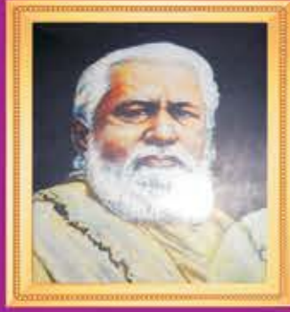
પ.પૂ. મુનિરાજ શ્રી ચારિત્રવિજયચ મ.સા.