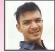
સંગીત : હાર્દિક પાસડ