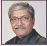
રૂપાંતર : ડૉ. વિશન નાગડા