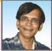
પુનઃલેખન - દિગ્દર્શન : વસંત ભારૂ