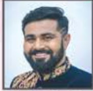
સહાયક દિગ્દર્શક/બેકગ્રાઉન્ડ સ્કોર : કવન સાવલા