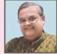
સેટ ડિઝાઇન : સુનીલ વિશ્રાણી

લેખક : વિનોદ સરવૈયા સ્ટેજ ડેકોરેટર : છેડા ડેકોરેટર્સ (રાયણ) (અમૃતભાઈ છેડા, સૌમિલભાઈ છેડા) સાઉન્ડ : શાહ સાઉન્ડ (નીરવ શાહ)