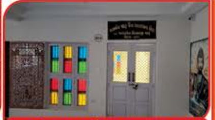
જયાબેન માડૂ જૈન આરાધના હોલ