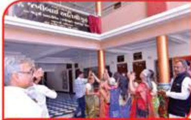
જખીબાઈ અતિથી ગૃહના ઉદ્ઘાટન કરતા દાતાઓ