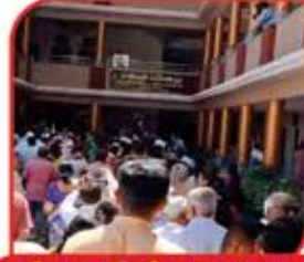
જખીબાઈ અતિથીગૃહ નાં ઉદ્ઘાટન નિમિત્તે ઉમટેલો માનવ મહેરામણ