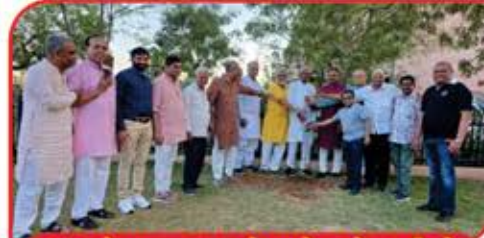
વૃક્ષ રોપણ કરતા મહેમાનો અને ટ્રસ્ટીઓ