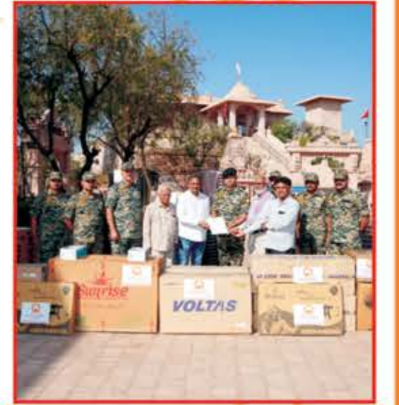
BSF Bn-90 યુનિટને આરતી પરિવાર તરફથી આપવામાં આવેલ ભેટ