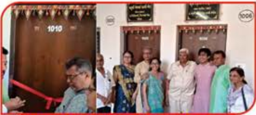
રૂમો ના દાતા પરિવારો દ્વારા ઉદ્ઘાટન