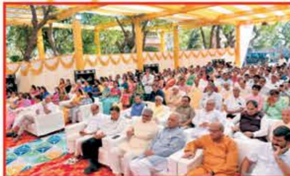
જખીબાઇ અતિથિગૃહ ઉદઘાટનમાં પધારેલ મહેમાનશ્રીઓ