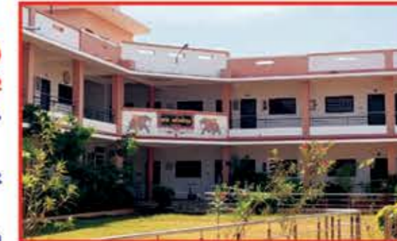
S.P.M. અતિથિગૃહ દાતાશ્રી : S.P.M. પરિવાર-પુનડી