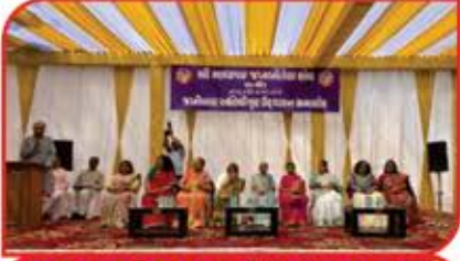
જખી અતિથીગૃહ નાં ઉદ્ઘાટન વખતે મંચ ઉપર બિરાજમાન નારી શક્તિ

નું ઉદ્ઘાટન સમારોહ ખૂબ જ હર્ષોલ્લાસથી અને ઉત્સાહથી ઉજવાઈ ગયો.