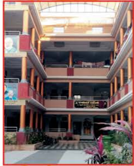
નવનિર્મિત જખીબાઇ અતિથિગૃહ