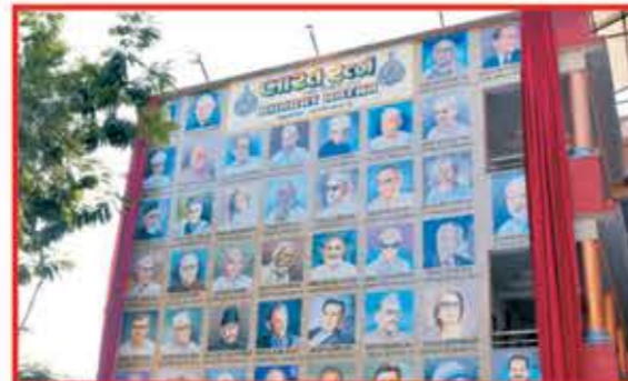
ભારત રત્ન પોર્ટરેટનું અનાવરણ

શ્રી માધાપર જખબૌતેરા સંઘ “જખ મંદિર” માધાપર સમસ્ત પરિવાર