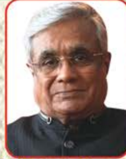
જિપીન અમરચંદ ગાલા રાયણ-દાદર