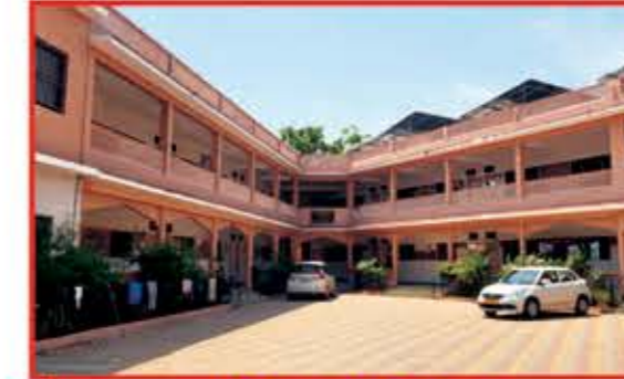
નવનિર્મિત અતિથિગૃહ દાતાશ્રી : નવનીત પરિવાર, અમદાવાદ-મુંબઇ