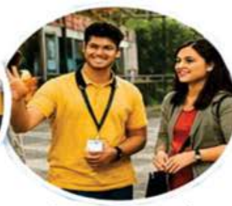
Innovative and Creative thinking