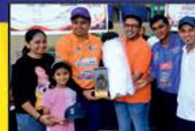
Viral Gala (Merau) Bombay Metrics Warriors

Most Valueable Player Purple Cap (Best Bowler) Player of Final