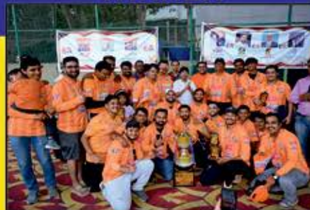
Bombay Metrics Warriors