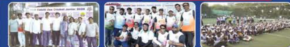
Junior Box Cricket Committee Team Mentors Participants