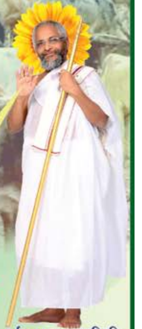
વર્તમાન અચલગચ્છાધિપતિ પ.પૂ.આ.ભ.