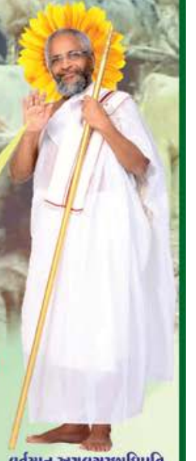
વર્તમાન અચલગચાધિપતિ પ.પૂ.આ.ભ.