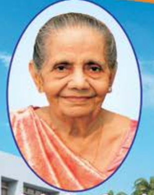
માતૃશ્રી સુંદરબેન જીમજી છેડા રતાડીયા (ગણેશવાલા)