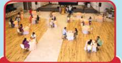
વન ટુ વન મીટિંગ કરી રહેલા ઉમેદવારો