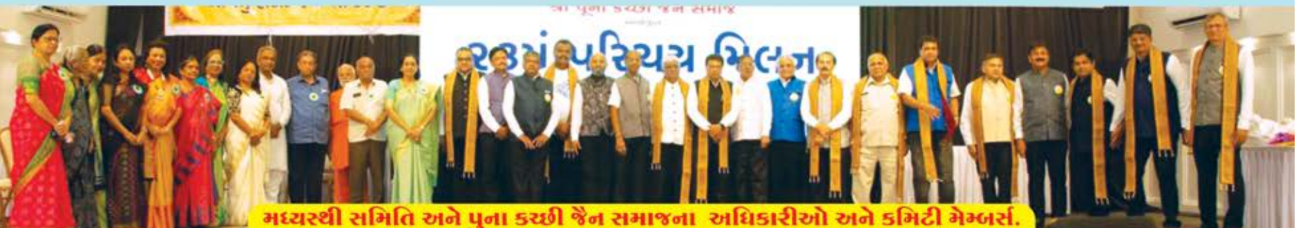
મધ્યસ્થી સમિતિ અને પુના કચ્છી જૈન સમાજના અધિકારીઓ અને કમિટી મેમ્બર્સ.