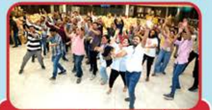
પ્રવૃત્તિ માણતા ઉમેદવારો લાક્ષણિક શૈલીમાં