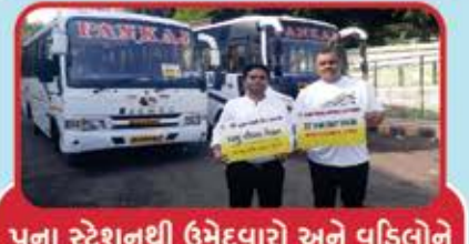
પુના સ્ટેશનથી ઉમેદવારો અને વડિલોને પીકઅપ કરનારા કાર્યકર્તાઓ

શ્રી કવિઓ કેન્દ્રીય મધ્યસ્થી સમિતિ અને શ્રી પુના કચ્છી જૈન સમાજ દ્વારા સંયુક્ત રીતે SPKJS નંદુ ભવન. ખાતે તારીખ ૧૧ અને ૧૨ મી મેના શનિ-રવિ બે દિવસીય ૨૩માં પરિચય મિલનનું આયોજન ખૂબ જ સફળતાપૂર્વક પાર પડેલ.