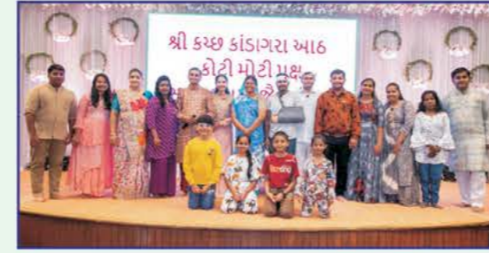
'પસ્તાવો' નાટકના સર્વ કલાકારો