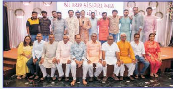
શ્રી કાંડાગરા આઠ કોટી મોટી પક્ષની જૂની અને નવી પેઢીના કાર્યકરો