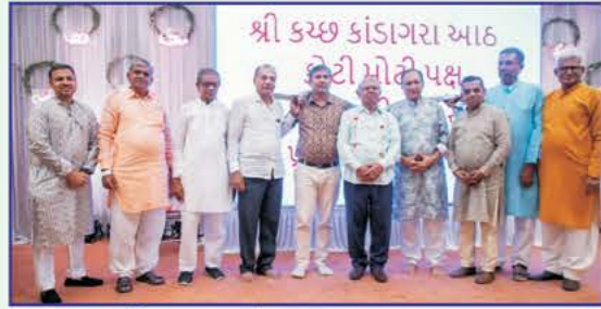
શ્રી કચ્છ કાંડાગરા મહાજનના પદાધિકારીઓનું સન્માન