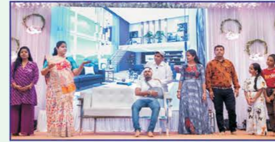
રંગમંચ પર અભિનય કરતા 'પસ્તાવો' નાટકના કલાકારો