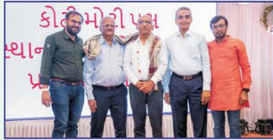
શ્રી કાંડાગરા અચલગચ્છ મૂર્તિપૂજક જૈન સંઘના પદાધિકારીઓનું સન્માન