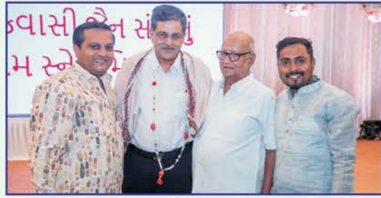
શ્રી કાંડાગરા આઠ કોટી નાની પક્ષ જૈન સંઘના પદાધિકારીઓનું સન્માન