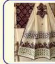
દરેક પ્રકારના બાંધણીના ફેસ- અજરખના ફેસ