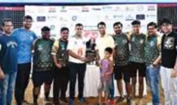
Mentors Cup Winners : Vikas Vikings