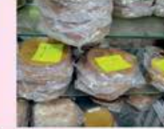
કચ્છ તથા મુંબઈના બધી જાતના ખાખરા