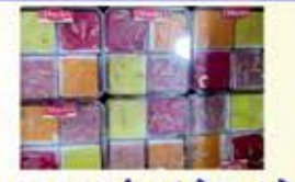
અંજનાના પેંડા, કચ્છના સાટા તથા મુંબઈનો હલવો