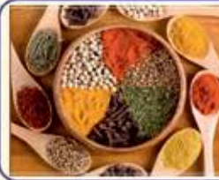
ખાસ ઉનાળામાં સીઝનમાં બધી જાતના મસાલા આખા તથા પીસેલા આખા વર્ષ ભરવા માટે