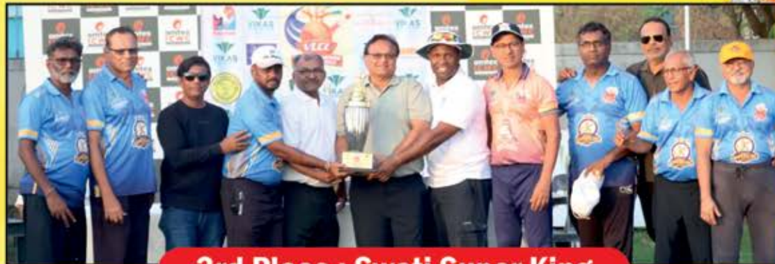
3rd Place : Swati Super King