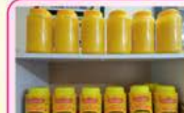
સારી ક્વોલીટીનું ઘી A-2 ગીર ગાયનું ઘી તથા A-2 ગીર દેશી ગાયનું ઘી