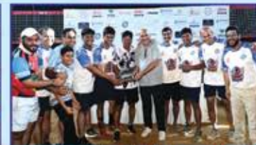
Mentors Cup 2nd Runner Up : Zalak Mavericks