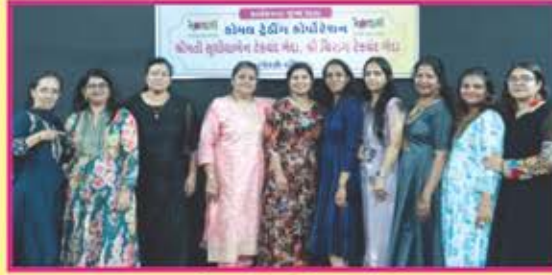
કાર્યક્રમની મહિલા કમિટી