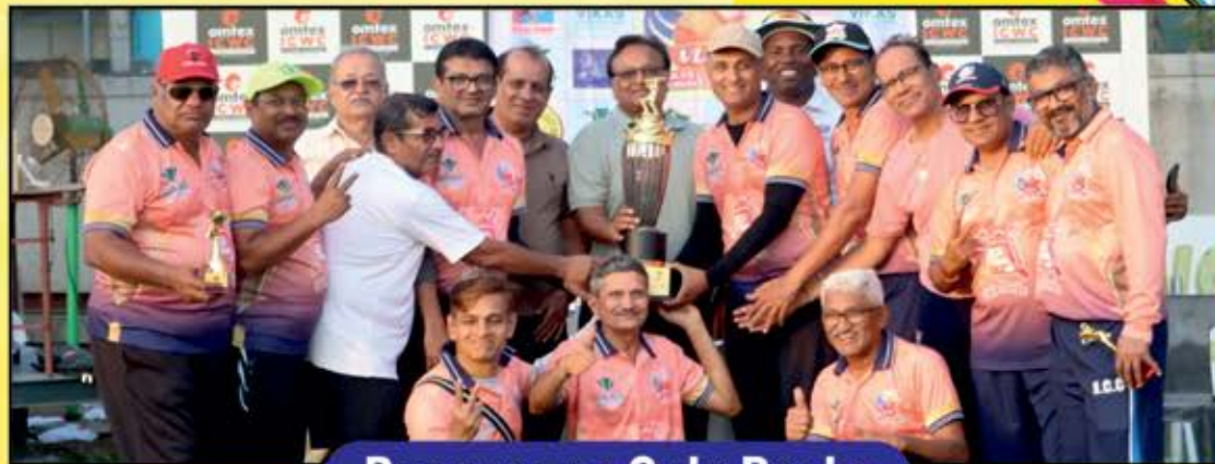
Runner up : Gala Rocks