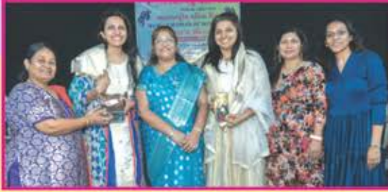
મુખ્ય દાતા પરિવારનું સન્માન