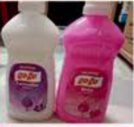
Hand Wash Liquid