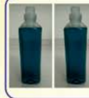
Machine Wash Liquid