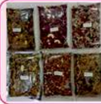
૫૦ જાતના વિવિધ રજવાડી મુખવાસ