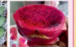
સીઝન પ્રમાણે ફ્રેગન ફ્રુટ, કેશર કેરી, હાપુસ, શકરટેટી, ખારેક