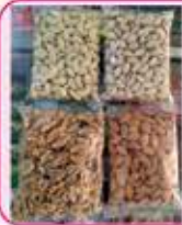
ખાસ દિવાળી પ્રસંગે મીઠાઈ તેમજ ડ્રાયફ્રુટ હોલસેલ ભાવે તથા સ્પેશિયલ કાજુ કતરી