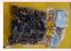
કચ્છની પ્યોર કાળી ખજૂર બારે માસ