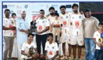
Mentors Cup Runner Up : Maru Mavericks