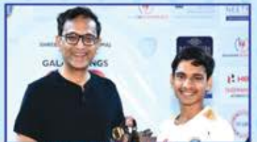
Mentors Cup Best Netty : Meet Furia (Bidada)