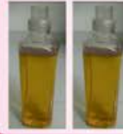
Cloth Wash Liquid