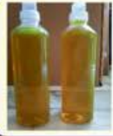
Dish Wash Liquid

રોજુંદા ઘર વપરાશ માટે સારી ક્વોલીટીના લીક્વીડ બારે માસ મળશે.