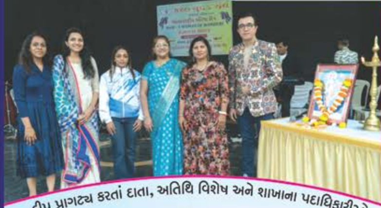
દીપ પ્રાગટ્ય કરતાં દાતા, અતિથિ વિશેષ અને શાખાના પદાધિકારીઓ

આંતરરાષ્ટ્રીય મહિલા દિવસ ઉજવણીની અવિસ્મરણીય પળો અને આભારની અભિવ્યક્તિ