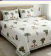
દરેક જાતની બેડ સીટ