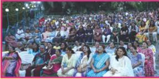
કાર્યક્રમને માણી રહેલ ૭૦૦ + મહિલાઓ