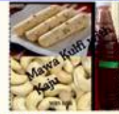
બધી જાતના સરબત-ફાલુદા