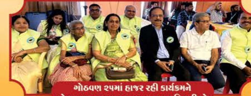
ગોઠવણ ૨૫માં હાજર રહી કાર્યક્રમને શોભાયમાન કરનાર મહાજનના પદાધિકારીઓ