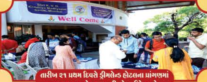
તારીખ ૨૧ પ્રથમ દિવસે ડ્રીમલેન્ડ હોટલના પ્રાંગણમાં સવારના રજીસ્ટ્રેશન કરાવી રહેલા ઉમેદવારો