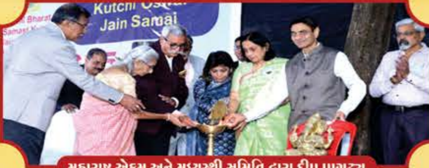
મહારાષ્ટ્ર એકમ અને મધ્યસ્થી સમિતિ દ્વારા દીપ પ્રાગટ્ય