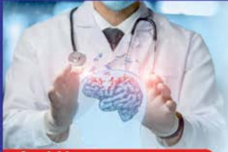
2nd Neurosurgeon in KVO Samaj

આપણી નજર સામે હસતો રમતો બાળક આપણા વ્હાલ અને લાડ ઝીલતો ઝીલતો મોટો થાય અને શૈક્ષણિક સિદ્ધિ પ્રાપ્ત કરે અને ન્યૂરોસર્જનની ડિગ્રી મેળવતો હોય ત્યારે આનંદની અનુભૂતિ થાય એને શબ્દોમાં કેવી રીતે વર્ણવી શકાય.