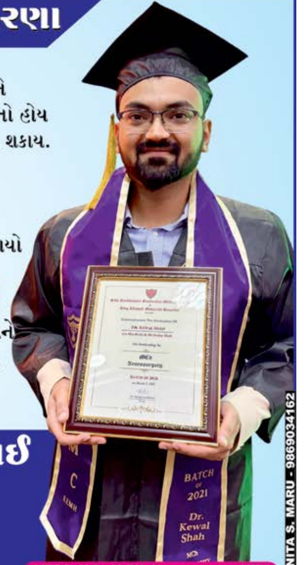
MBBS, M.S., M CH. Neurosurgeon KEM