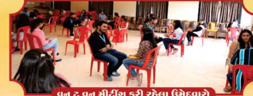
વન દુ વન મીટીંગ કરી રહેલા ઉમેદવારો