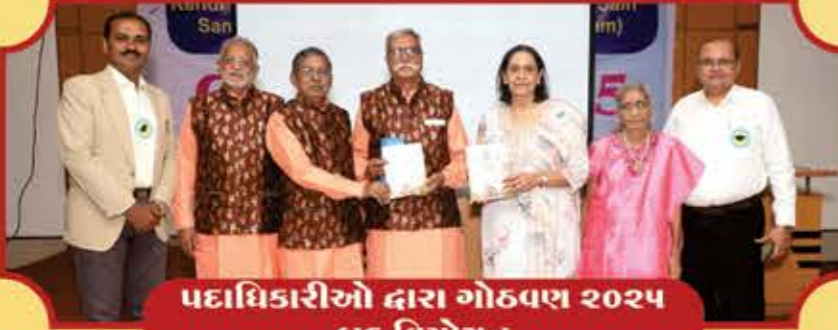
પદાધિકારીઓ દ્વારા ગોઠવણ ૨૦૨૫ બુક વિમોચન