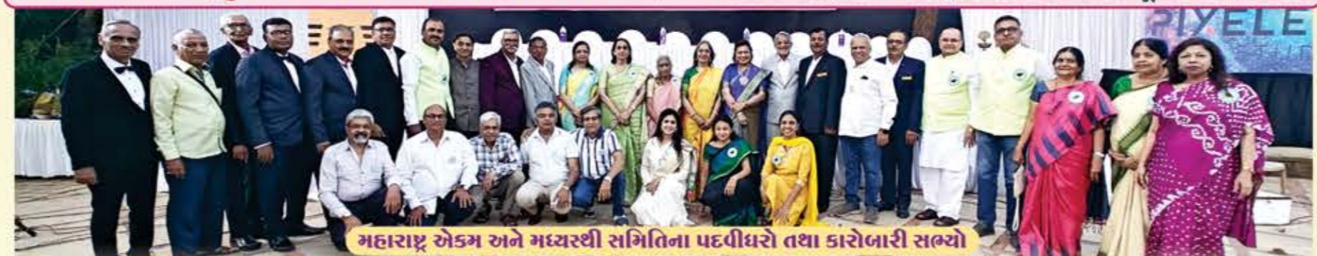
મહારાષ્ટ્ર એકમ અને મધ્યસ્થી સમિતિના પદવીધરો તથા કારોબારી સભ્યો