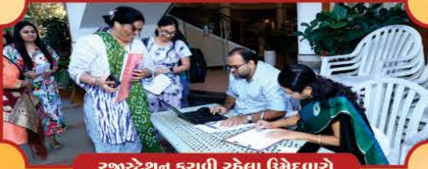
રજીસ્ટ્રેશન કરાવી રહેલા ઉમેદવારો