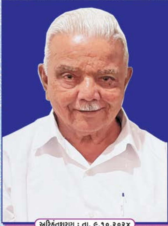
અરિહંતશરણ : તા. ૯.૧૦.૨૦૨૪

તલવાણા રંગુનમાં સર્જાયેલ સ્નેહ સંબંધો પત્રી ૩ પેઢીએ પણ પારિવારીકતુલ્ય છે. આદરણીય પિતાતુલ્ય વડીલશ્રીને આદરાંજલિ