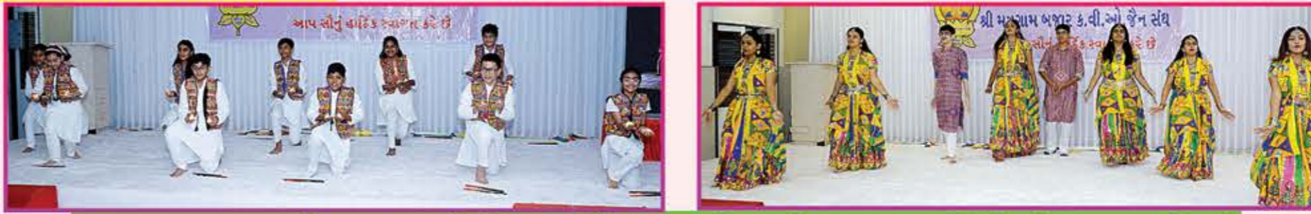
Children Youth અને યુવા યુથ કમિટીના સભ્યોએ સ્વાગતગીત સાથે ગ્રુપ ડાન્સ કરી દરેકનું સ્વાગત કર્યું હતું