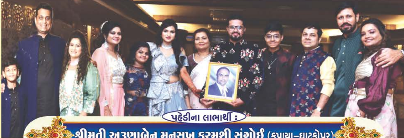
પહેડીના લાભાર્થી :

હૈયુ હરખાય છે...મનડુ મલકાય છે...અંતરની ગાગર સ્નેહથી છલકાય છે... પહેડીની રળિયામણી ઘડી આવી ગઈ છે...હૈયાના હેતથી સૌને સ્નેહભર્યો નોતરો