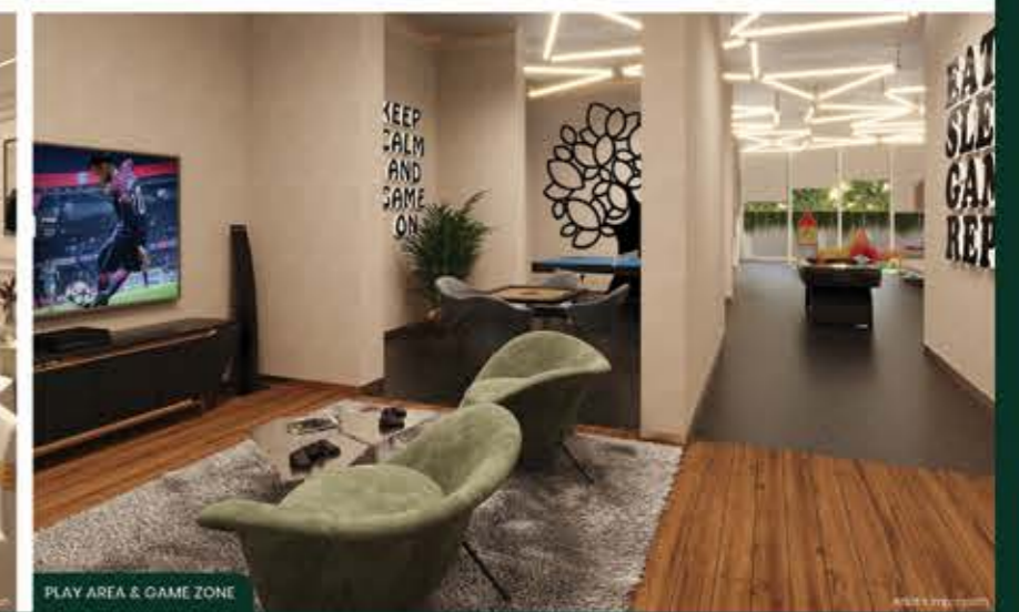
PLAY AREA & GAME ZONE

Book your appointment for Experience Centre & Jade Suite Show Apartment