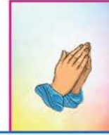
એક શુભેચ્છક દાતા પરિવાર