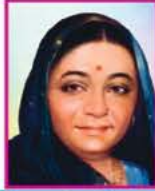
માતુશ્રી લાખણીબાઈ રામજી ગાલા (રાચણ-મુંબઈ-અમદાવાદ) નવનીત પરિવાર