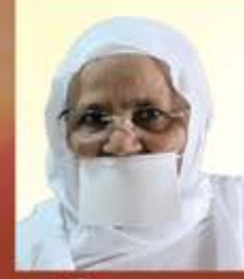
પૂ. શ્રી કમલપ્રભાજી મ.સ.