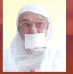
પૂ. શ્રી રક્ષાજી મ.સ.