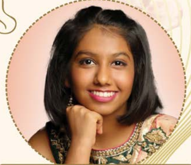
ચિ. ભારવી નવદીપ વોરા

દેવગુરૂ કૃપા, વડીલોનાં આશિષ અને પુણ્યોદયના પ્રતાપે