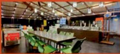
Pure Veg Restaurant