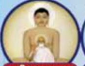
શ્રી અજરામર તીર્થધામ