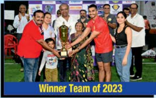
Winner Team of 2023