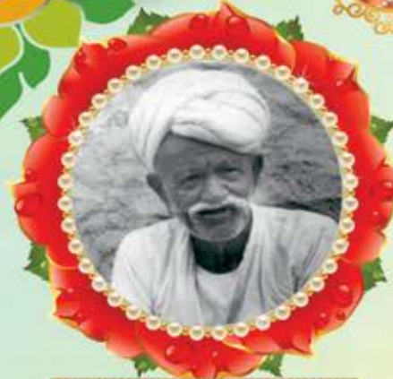
મામા-બાપા શા. લધા નેણશી ખુશીયા (ના. તુંબડી)