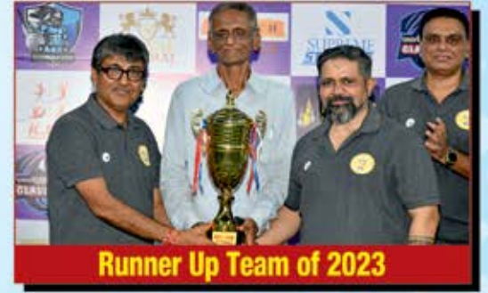
Runner Up Team of 2023