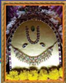
રામદેવપીર મંદિર વર્ષ ૪૪મું

ભાદરવા સુદ - એકમ તા. ૧૬/૯/૨૩થી ભાદરવા સુદ-અગીયારસ તા. ૨૬/૯/૨૩ મંગળવાર સુધી રામાપીરની નવરાત્રી મંદિરમાં ઉજવવામાં આવશે.