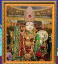
સરચામાં મંદિર વર્ષ ૨૦મું