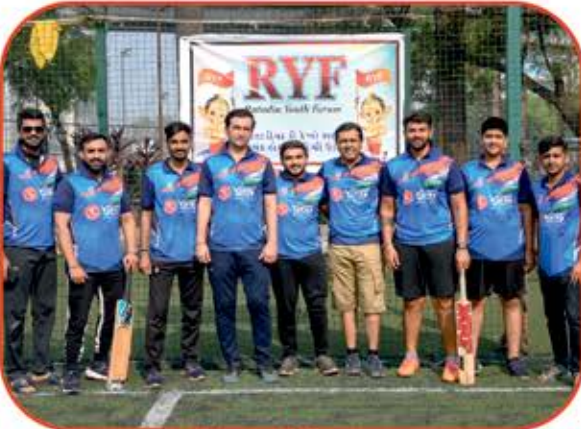
Boys Winner RG RISING STAR