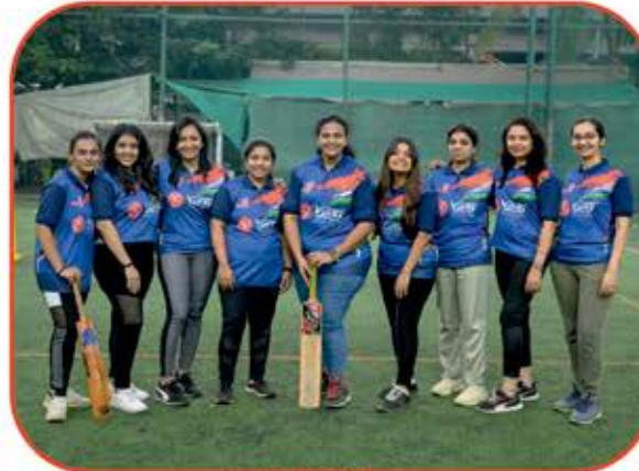
Girls Winner RG GLADIATORS