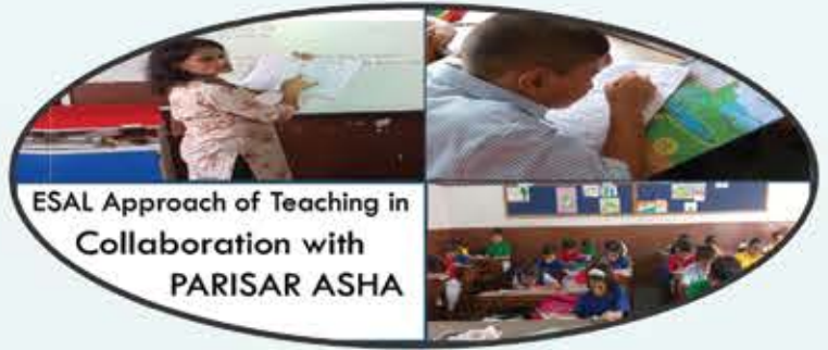
ESAL Approach of Teaching in Collaboration with PARISAR ASHA

Special Scholarship to all KVO Students on fees from KVO STHANAKWASI JAIN MAHAJAN