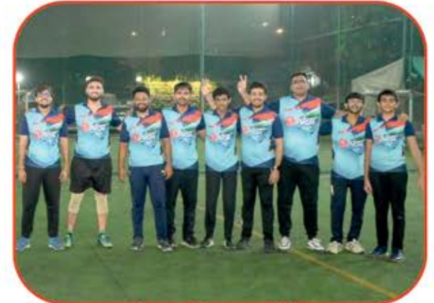
Boys Runner Up RG TITANS