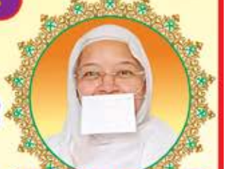
પૂ. કિર્તિજાજી મ.સ.