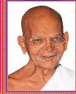
વર્ધમાન તપોભિષ્ણ્યયવિહારક, મચ્છાધિપતિ પ.પૂ.આ.ભ. શ્રી લુવનલાનુસૂરીશ્વરજી મ.સા.