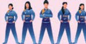
PLATE Division 3 rd MAY

સર્વે ક્રિકેટપ્રેમી ચાહકોને ખેલાડીઓને પ્રોત્સાહિત કરવા બહોળી સંખ્યામાં પધારવા હાર્દિક આમંત્રણ.