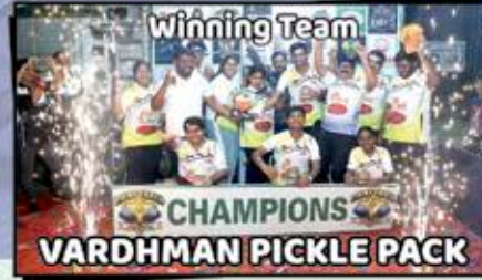
Winning Team VARDHMAN PICKLE PACK