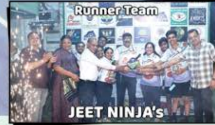
Runner Team JEET NINJA's