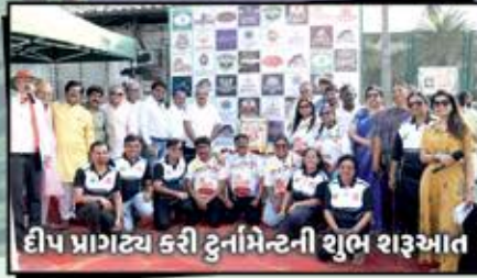
દીપ પ્રાગટ્ય કરી ટુર્નામેન્ટની શુભ શરૂઆત