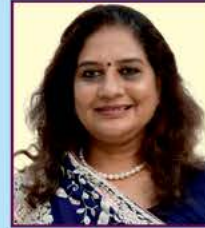
શ્રી ઉત્કલ ગડા (ભાડા)