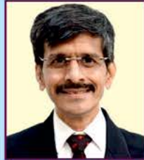
ઉત્કલ રતનશી ગડા (ભાડા)