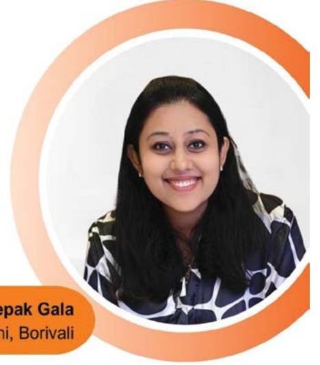
Jinal Ronak Deepak Gala Luni, Borivali

Confused about a career in Design? Attend our FREE 4-Days Design Quest to Explore New-Age Design Careers. Don't Miss Out! Secure Your Seat Now.