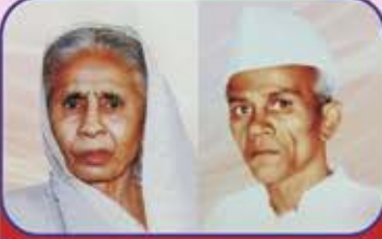
માતુશ્રી ગંગાબેન મુરજી નાનજી ગોગરી પરિવાર