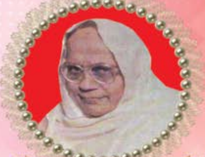
શાસનપ્રભાવિકા પ.પૂ. વિદ્યુતપ્રભાશ્રીજી મ.સા.