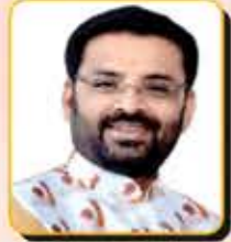
શ્રી વિનોદ ચાવડા MP, Kutch-Morbi