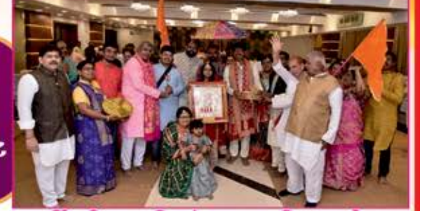
લાભાર્થી પરિવારની અંતઃકરણથી અનુમોદના

માતાજીની પહેડી સાથે સહુ ભાવિકોને ઘર દીઠ લહાણી, સર્વે નિયાણી બહેનોને ભેટ તેમજ સર્વે વડીલોનું સન્માન વગેરેનો અનેરો લાભ લાભાર્થી પરિવારે લીધેલ. દિલેર લાભાર્થી પરિવારની સંઘ ખૂબ ખૂબ અનુમોદના કરે છે.