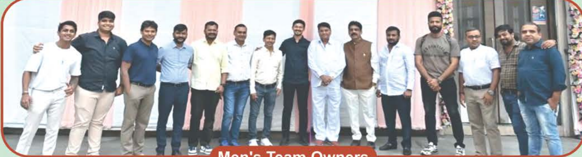
Men's Team Owners