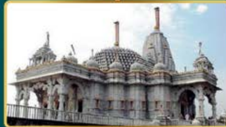
Jain Derasar In Premises