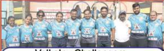
Valkalx Challengers Milki Chetan Gosar