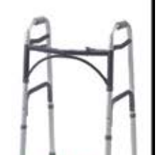
ફોર લેગ વૉકર