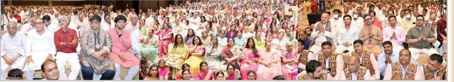
૩. અમેરીકા, મસ્કત, આફ્રિકા, ગોંડલ, ધોરાજી, કલકતા, રાયપુર, જલગાંવ, ચવતમાલ, પૂના, ઈન્દોર, ચેન્નાઈ, જુનાગઢ, અમદાવાદ, ધંધુકા, સુરત, જામનગર, વાપી, બરોડા, દેવલાલી, લોનાવાલા, ખપોલી, જશાપર, કાટકોલા, વિરાર, રાજકોટ - મુંબઈના વિવિધ સંઘો વગેરે