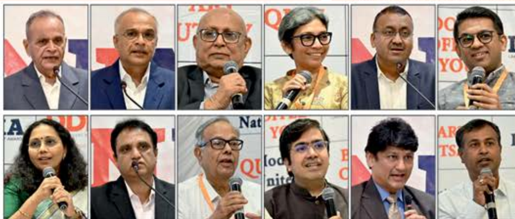
Honorable speakers who enlightened the ceremony with their knowledge