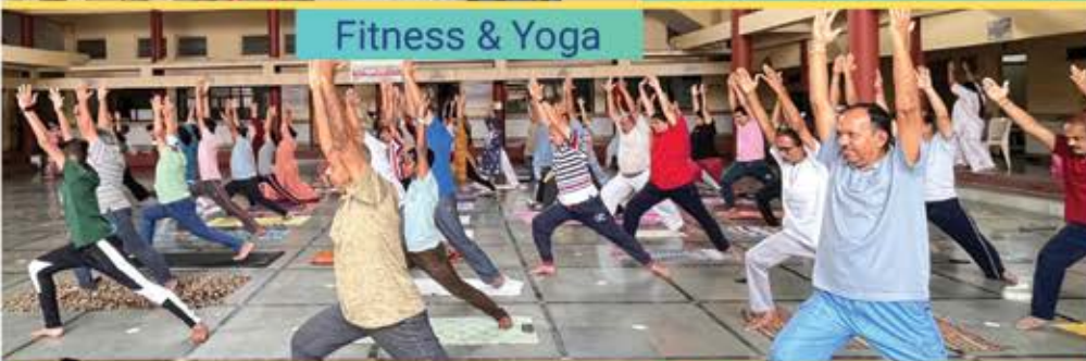
Fitness & Yoga

તત્ત્વમ શ્રુત યાત્રાની અનુમોદના કરતા કૃતજ્ઞ અને શ્રુતપ્રેમી પરિવારો