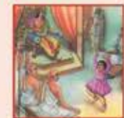
Shree Vraj Swami