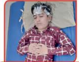
ફિટ-વાઈ રોગનો બાળદર્દી