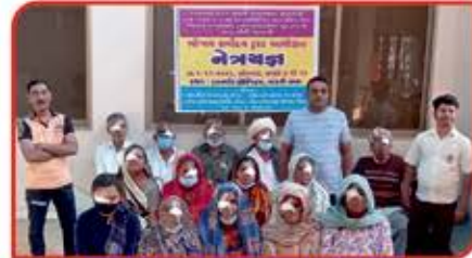
અમને નવી રોશની મળી