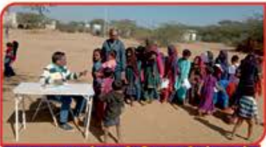
સુદુરના ગામો સુધી વિસ્તરતી સેવાઓ