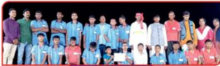
માનસ મંદિરના બાળકો