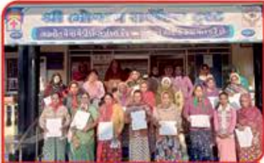
શિરમોર પ્રવૃત્તિ સ્ત્રીરોગ શિબિર

૨૫ વર્ષની સફરમાં ઘણી અડચણો પાર કરી છે. સિમાચિન્હ રૂપી પડકારો હતા (૧) સુદુરના ગામડાઓ સુધી આરોગ્ય સેવાઓ વિસ્તારવી (૨) મહિલાઓમાં પ્રજનન અવયવોનાં રોગો સંબંધી તપાસ - ઓપરેશન અંગે સંકોચ અને ભય દૂર કરવા (૩) ધરતીકંપમાં મેડીકલ પ્રવૃત્તિઓ અને ત્યાર પછીના પુનર્વસન અને ઘરબાંધકામ પ્રવૃત્તિ (૪) મંદબુદ્ધિના બાળકોને તાલીમ આપી સ્વાવલંબી કરવા (૫) ૪૦૦ ગામડાઓમાં સ્થાનિકે આંખના દરદીઓની તપાસ (૬) મહિલાઓ અને બાળકો માટે વિવિધ કેન્દ્રો પર તપાસણી (૭) કોરોના મહામારી વચ્ચે આરોગ્ય પ્રવૃત્તિઓ જારી રાખવી. (૮) કોરોના કાળમાં ગામડાના દરદીઓ માટે ડાયાલીસીસની સુવિધાઓ ઉભી કરવી. આગવી સુઝબુઝ અને હકારાત્મક અભિગમથી દરેક પડકારો ઝીલી ૨૫ વર્ષની સફર પૂર્ણ કરી છે.