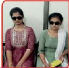
બે સગી બહેનોની નેત્રજ્યોતિ પ્રગટી