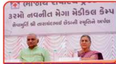
અતિથી વિશેષ આમટે દંપતી