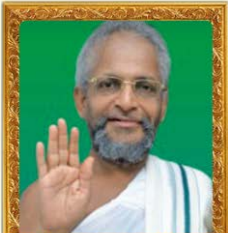
ગુરુ ચરણ શ્રેષ્ઠતમમ્... ગુરુ ચરણ વિશેષતમમ્... ગુરુ વચન મંગલમ્... ગુરુ નમન ઉત્તમોતમમ્...