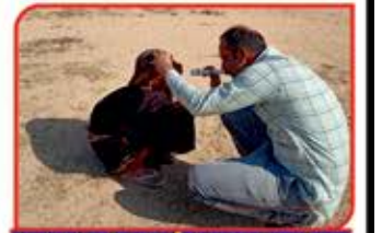
છેવાડેનો દર્દી અમારો ભેરૂ

ભોજય સર્વોદય ટ્રસ્ટે વર્ષ ૨૦૨૨-૨૩ દરમ્યાન ૨૫૦૦ થી વધારે દરદીઓનાં વિવિધ ઓપરેશનો કરી, રજત જયંતિ વર્ષની ઉજવણી કરવાનો નિર્ધાર કર્યો હતો અને અમને જણાવતાં હર્ષ થાય છે કે ૨૫૪૮ ઓપરેશનો કરી અમારો સંકલ્પ પાર પાડ્યો છે. દરદીઓના આશીર્વાદ અને અનુદાતાઓનાં વિશ્વાસને સહારે જે કાર્ય પાર પડ્યું છે તેની નોંધ (ફેકલ્ટી પ્રમાણે ઓપરેશન) લેતા આનંદ અનુભવીએ છીએ.