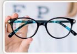
LATEST EYEWEAR STYLES