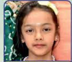
મોહા પ્રતિક ગડા (મોટા લાચજા) પ્રથમ શ્રેણી (મોખિડ) ધોરણ : ૧, ગુણ : ૭૯