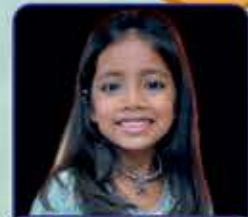
સાચેશા પ્રતિક ગાલા (મોટા આસંબિયા) પ્રથમ ક્રમાંક (મોખિડ) ધોરણ : ૨, ગુણ : ૧૦૦