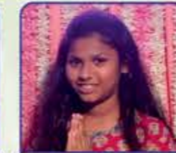
ઇલક પરીન ગાલા (દુર્ગાપુર) દ્વિતીય ક્રમાંક (મોખિડ) ધોરણ : ૬, ગુણ : ૮૧