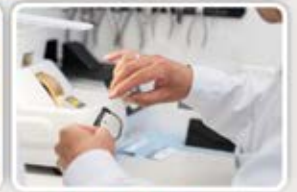
MADE WITH PRECISION

આંખની મક્કત તપાસ માટે આજે જ અમારી મુલાકાત લો.