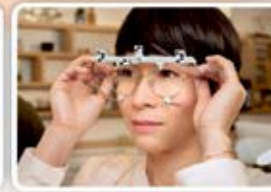
MODERN DIGITAL LENSES