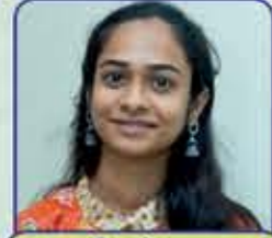
અપની મહેશ ગાલા (નાગેચા) દ્વિતીય શ્રેણી ધોરણ : ૧૦, ગુણ : ૫૯