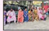
March 2023 CST to Panvel Resident