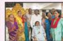
January 2024 Bhiwandi Resident