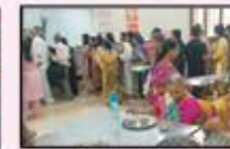
October 2023 Churchgate to Virar Resident