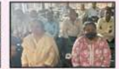
February 2023 Bhiwandi Resident