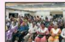
May 2024 CST to Kalyan (Resi.)