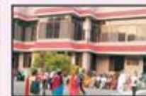
August 2023 Virar to Vapi Resident