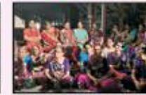
January 2023 CST to Kalyan Resident