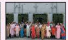
April 2024 Churchgate to Virar (Resi.)