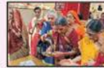
September 2022 Full Mumbai Resident

ગુટકા પરિવારના સૌજન્યથી નિ:શુલ્ક એક દિવસીય યાત્રા :