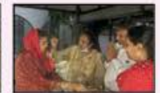
November 2023 CST to Kalyan Resident