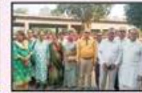
December 2022 Churchget to Virar (Resi.)