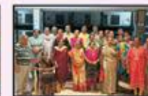
Feb 2024 Virar to Vapi (Resi.)