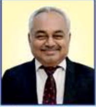
વસંત ચાંપશી ગડા (ગુંદાલા)