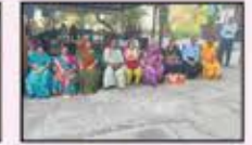
June 2023 CST to Panvel Resident