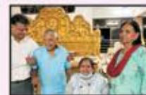
December 2023 CST to Panvel (Resi.)