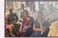
April 2023 Churchgate to Virar Res.