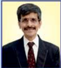
ઉત્કલ રતનશી ગડા (ભાડા)