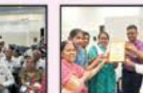
June 2024 CST to Panvel (Resi.)