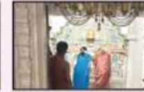
May 2023 CST to Kalyan (Resi.)