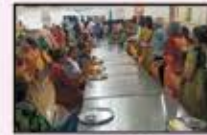
July 2023 Bhiwandi Resident