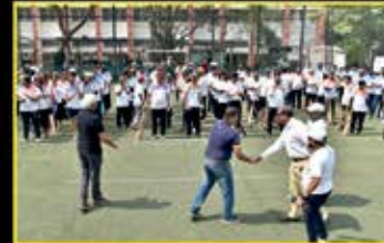
May : Turf cricket