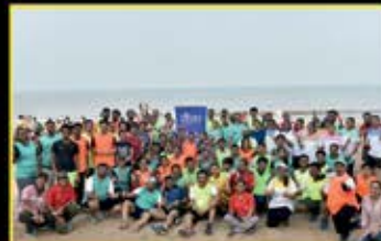
April : Beach Games