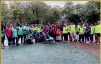
August : Scavenger Hunt

સંપૂર્ણ વર્ષભર મોજમસ્તી સાથે શારીરિક ફિટનેસ માટેના આયોજિત દરેક કાર્યક્રમોને આપના ઉત્કૃષ્ટ પ્રતિસાદથી સફળતા પ્રદાન કરવા બદલ સર્વ મેમ્બર્સનો આભાર.