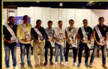
September : Comrades Party