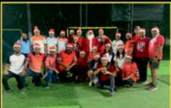
December : Xmas Fun play