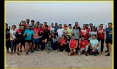
January : Zumba Time