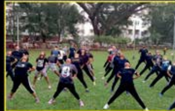
Play Station workout