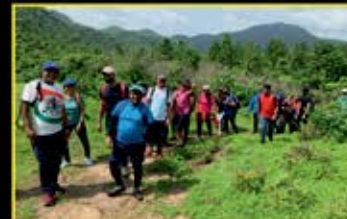
July : Trek