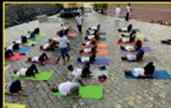
June : Yoga