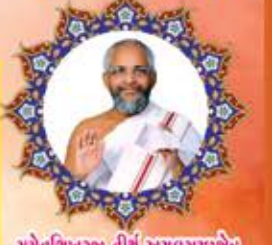
સમેતશિખરજી તીર્થ અચલગચ્છકલેત્ર જીર્ણોદ્ધારક પ્રેરક અચલગચ્છાધિપતિ પૂ.પૂ.આ.ભ. શ્રી કલાપભસાગરસૂરીધરજી મ.સા.