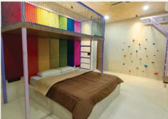
► Kids Room