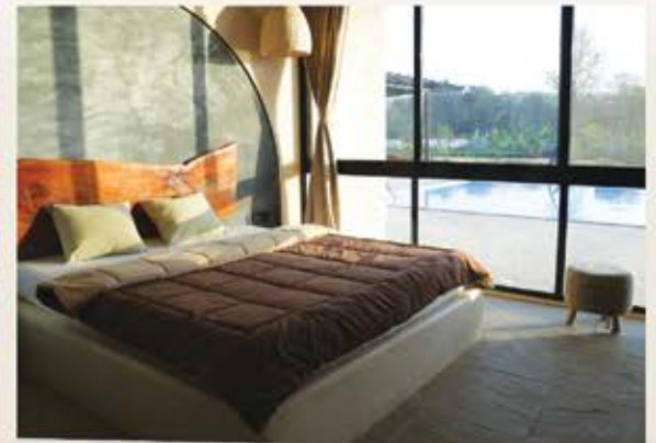
► Luxury Bedrooms