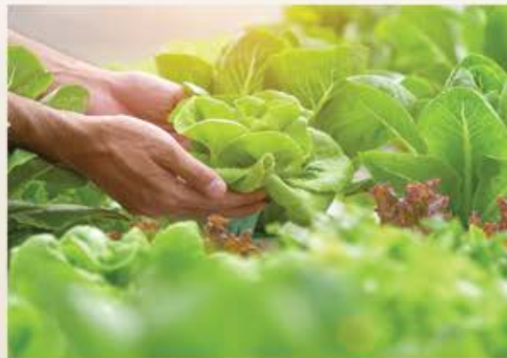
► Organic Farming