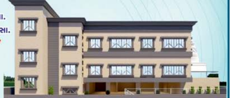
નવનિર્મિત વીરા આરાધના ભવન