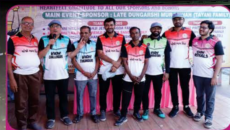
VPL 2024 Core Committee