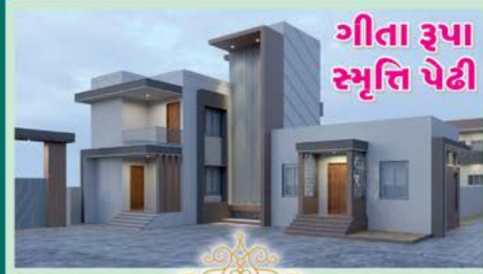
ગીતા રૂપા સ્મૃતિ પેઢી