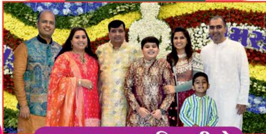
આપણા ગામના નિયાણીઓ