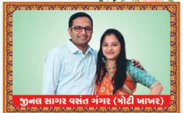
જુનલ સાગર વસંત ગંગર (મોટી ખાખર)